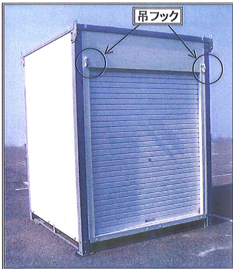
ハウスに取付けた状態